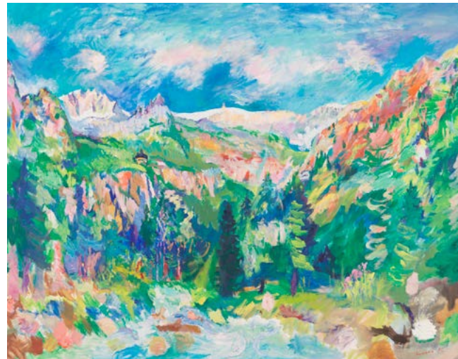
Val di Borzago con rifugio Carè Alto e Croz da la Stria settembre 1992 | olio su tela | 95x120 cm