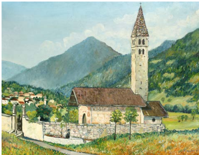
Chiesa di Sant'Antonio Abate e cimitero dipinto in giovane età Estate 1964 | olio su legno | 44 x56 cm

Fu sulle pendici del monte alle spalle del piccolo cimitero che R.N. si disse: diventerò pittore artistico!