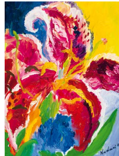
Il giglio | 2002-07-31 | olio su tela | 40x30 cm

dipinto in Val di Borzago, in posa dalla natura