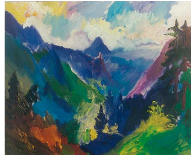
Ore serali in montagna, (Val di Borzago) 1999-06-29 | olio su cartone | 50x60 cm (quadro della Collezione Leopold II di Vienna)

Un omaggio agli alpinisti e agli innamorati ...