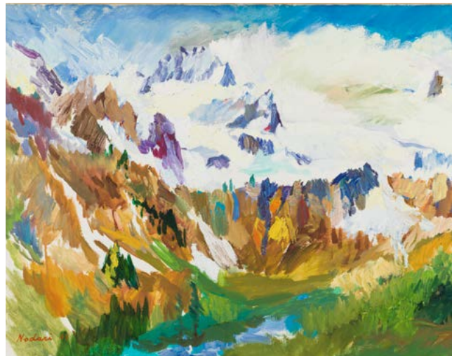
Vicino alle rocce del Carè Alto in Val di Borzago, 2001-09-13 | olio su tela | 55x74 cm