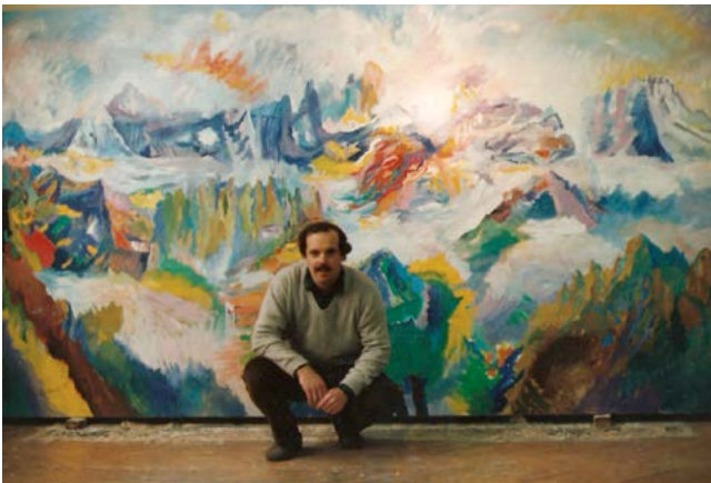
R.N. di fronte al quadro "Adamello" di gran formato oggi esposto all'ospedale AKH di Vienna