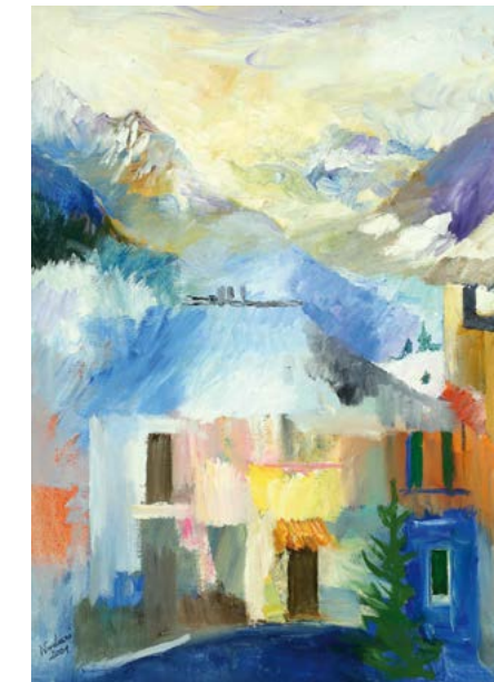
Un paesaggio di montagna in inverno, Casa Modesto | 2001-01-12 | olio su tela | 56 x45 cm