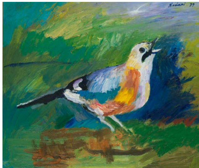
L'uccello chiamato "Russo" | 1999-09-15 | su cartone | 50x60 cm